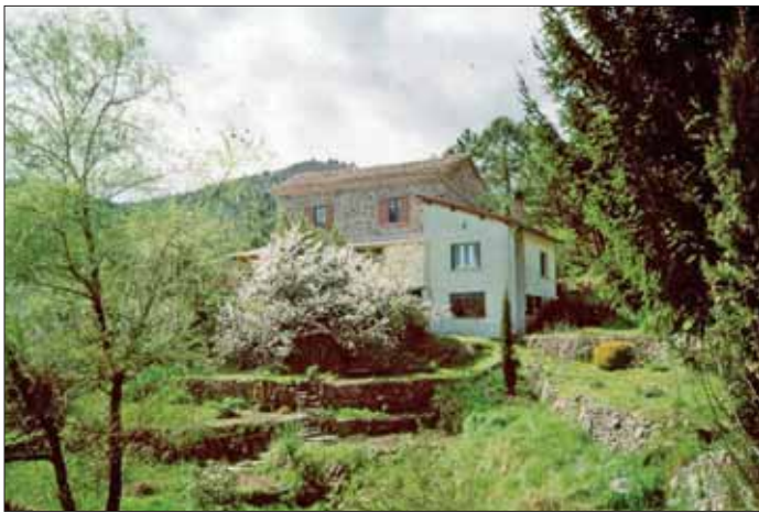
Anwesen von der Gartenseite her. Die beiden oberen Fenster gehören zur Ferienwohnung.