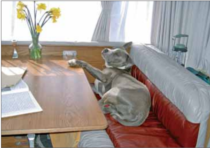
So lässt sich's leben! Wann wird serviert? – fragt der American Staffordshire Terrier Toni.