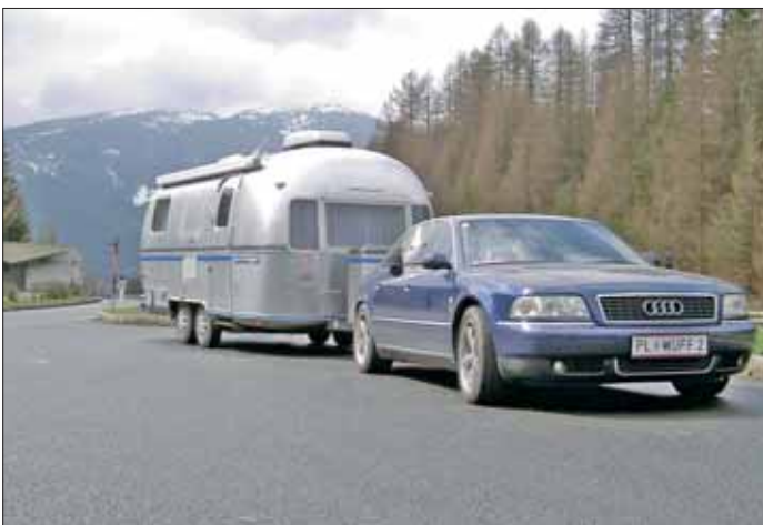
Zwischenstopp am Brenner. Über zwei Grad und Schnee können nur noch die Erinnerungen an den Gardasee hinweg trösten.

Obwohl man in dieser Region keine Ziele braucht, um zu lustwandeln, so gibt es doch einige Orte, die man besuchen sollte. Einer davon ist ein Geheimtipp und befindet sich am südlichsten Ende des Sees. Es ist ein liebevoll restauriertes Agriturismo ( www.pratello.com ) im Ort Padenghe. Ein biologisch geführter Hof, wo die Chefin des Hauses selbst am Herd steht und Köst-