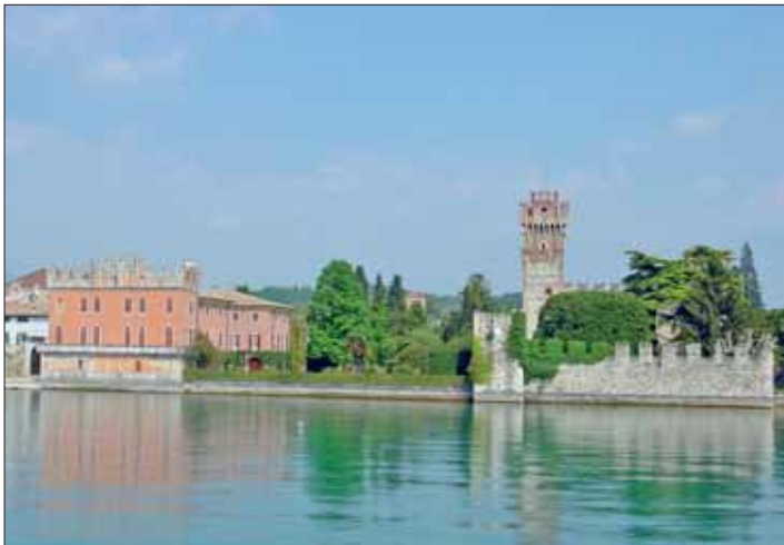
Lazise mit seiner wunderschönen Altstadt und seinen lieblichen Cafés an der Seepromenade ist einen Ausflug wert.

gendwo Probleme, mit dem Hund einen Campingplatz zu finden. Trotzdem empfiehlt es sich, vorher abzuklären, ob Hunde erlaubt sind. Wir urlauben immer in der Region Bardolino/Lazise, also im südlichen Teil des Gardasees. Dort gibt es einige direkt am See gelegene Campingplätze, bei denen Hunde erlaubt sind. Oft sind in der Nebensaison Hunde erlaubt, obwohl im Campingführer ein Hundeverbot steht. Ein Anruf kann sich also lohnen. Ich lege jedoch allen Hundebesitzern ans Herz, ihre Hunde auf dem Campingplatz so zu halten, dass andere Gäste nicht gestört werden. Also den Hund nicht frei auf dem Campingplatz laufen lassen, sondern an der Leine führen und keinesfalls sein Geschäft im Campingbereich verrichten lassen. Ein paar Beschwerden genügen, und schon wird auf einem Campingplatz ein Hundeverbot verhängt. Beschwichtigungen wie „meiner tut eh nichts“ verfehlen meist die Wirkung, wobei hier die deutschen Touristen in der Regel viel empfindlicher sind als etwa die Italiener oder die Österreicher. Kein Wunder, denn Italiener und Österreicher lesen keine Bild-Zeitung, in der die Leser meiner Meinung nach in hundefeindlicher Weise verhetzt werden.