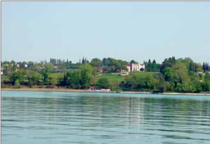
Heimweg vom Schiffs-Ausflug nach Sirmione, ein zwar sehr touristischer, aber dennoch sehenswerter Ort.