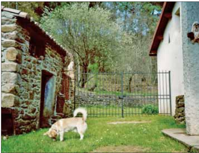
Auslauf zum Garten hin