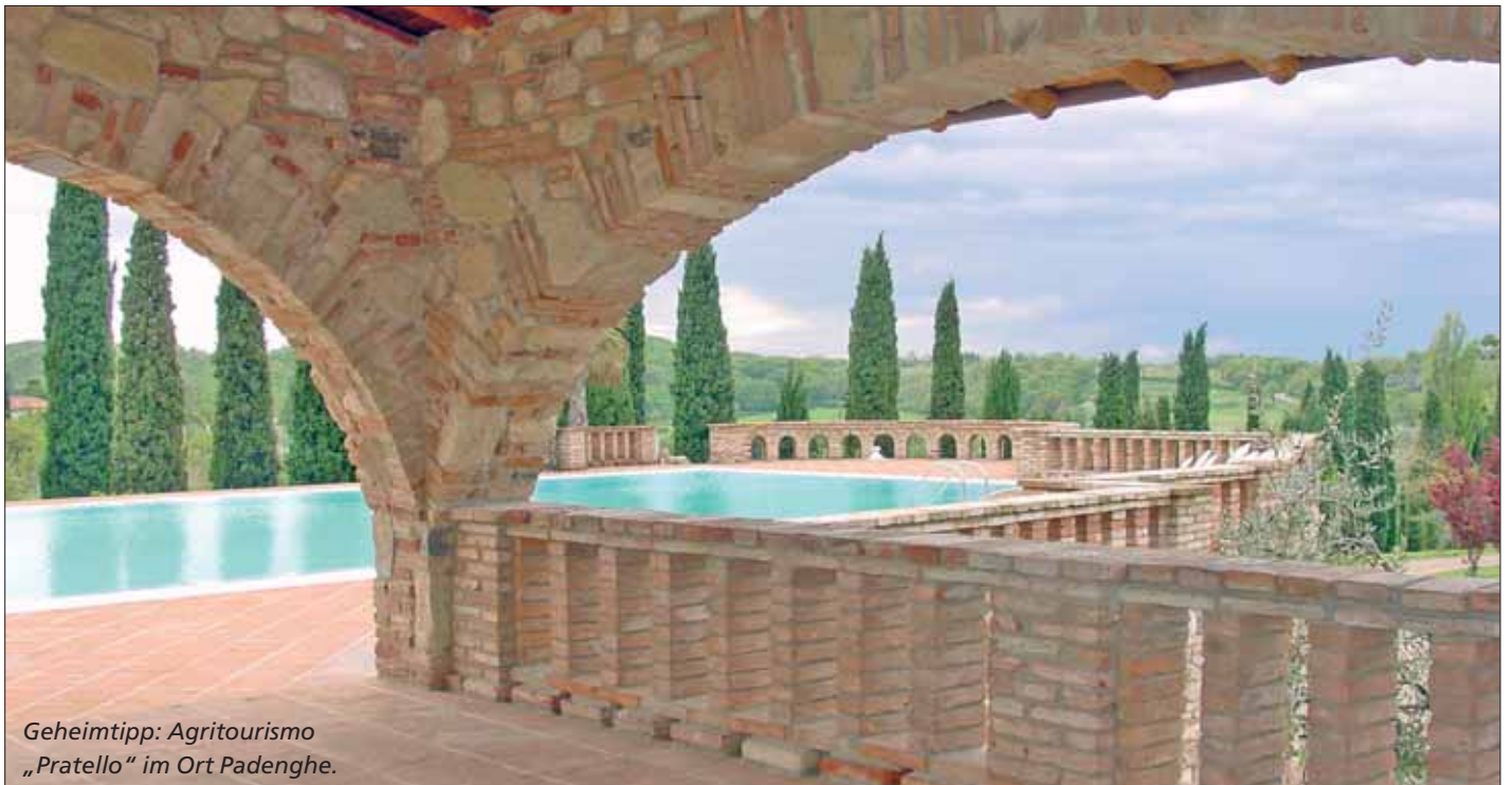
Geheimtipp: Agriturismo „Pratello“ im Ort Padenghe.

Jedes Jahr dasselbe Ritual. Eröffnung der Urlaubssaison am Gardasee. Wenn in unseren Ländern noch der Frost in den Tälern sitzt und die letzten Schneehügel einfach nicht dahinschmelzen wollen, dann ist es so weit. Dann zieht es uns in den sonnigen Süden, wo bereits im April die mediterranen Hecken blühen und die Tage nach Bikini und Badehose rufen.