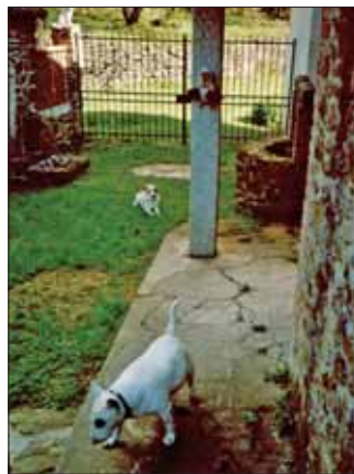
Auslauf von der Treppe zur Ferienwohnung aus gesehen.