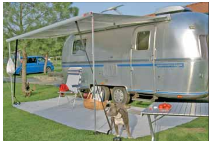
Toni genießt die Abendsonne vor unserem amerikanischen Airstream-Wohnwagen.

Fast hätte ich vergessen zu erwähnen, dass natürlich mein Hund Toni auch immer dabei ist. Auch er schätzt die ersten warmen Tage unter der südlichen Sonne. In der Vorsaison hat man fast nir-