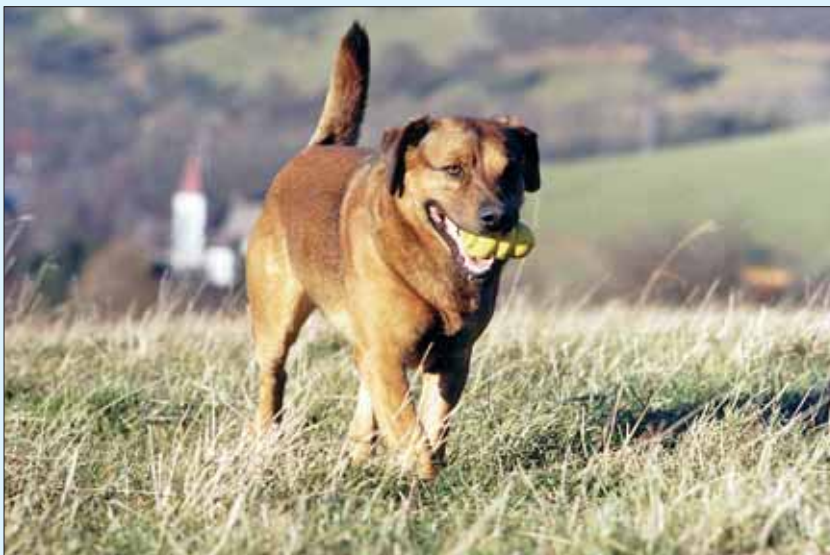
Apportieren zählt zu den Lieblingseigenschaften der Pinscher.