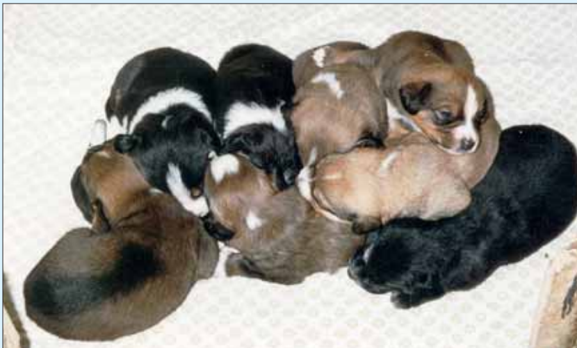
In diesem Wurf liegen falbe, schwarz-lohfarbene und schwarze Welpen mit unterschiedlichen weißen Abzeichen.

Der Verwendungszweck des Österreichischen Pinschers war immer klar definiert: Hof- und Haushund mit vielseitigen Talenten. Wachsamkeit ist ein wesentliches