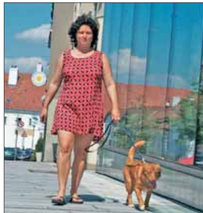
Der Toller ist zwar in der Stadt zu halten, wird jedoch mit nur Gassi gehen nicht glücklich.

Über den Ursprung der Duck Tolling Retriever und ihre besonderen Jagdart gibt es viele unterschiedliche Angaben. Vermutlich kann man sich die Geschichte des Tollers so vorstellen: Indianer beobachteten Füchse, die im Schilf auf und abliefen und mit ihren ruckartigen Bewegungen und den buschigen Schweifen die von Natur aus neugierigen Enten anlockten. Das erfolgreiche Jagdverhalten der Füchse gab vielleicht den Anreiz, Hunde mit ähnlichen Eigenschaften zu züchten. Auch die folgende Version wäre plausibel: Verarmte Schotten, die nach Kanada auswanderten, brachten die Urform des Tollers mit und nutzten die natürli-