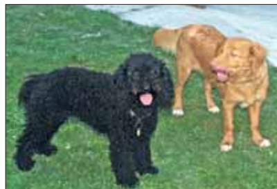
Als Welpen Kontakt zu anderen Hunden ist wichtig, damit der Toller ein gutes Sozialverhalten bekommt.

che Verspieltheit der Hunde und ihren Gehorsam für diese ungewöhnliche Jagdmethode.