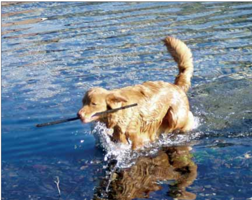
Apport im Wasser – Für den Hund nicht nur Arbeit, sondern Spaß.

cken diese Hunde Enten an, um sie nach erfolgtem Schuss mit weichem Maul zu apportieren (die holländischen Kooikerhondje sind ebenfalls für diese Art der Jagd gezüchtet und zählen vielleicht zu den Ahnen der Toller). Diese Art der Jagd wird „Tolling“ genannt: Der Hund läuft dabei im seichten Wasser auf und ab und trägt die buschige Rute über dem Rücken. Die von Natur aus neugierigen Enten lassen sich von dem seltsamen Verhalten des Hundes und dem auf und ab wippenden Schweif anlocken, bis sie entweder in Schussreichweite sind oder in einem Decoy (einem sich verengenden Netzsystem) gefangen sind.