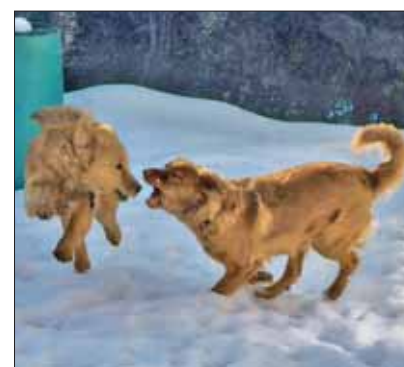
Zwei Toller – im doppelten Sinn. Sich richtig austoben zu können ist für diese Hunde sehr wichtig.

Dummyarbeit zählt für viele Toller-Besitzer zur wichtigsten Ausbildung für ihren Hund. Sie fordert den Hund rassetypisch, ist zwar die Vorbereitung auf die Jagd, bleibt aber für viele Hundeführer und Hunde (geliebter) Selbstzweck. Auch Dummyarbeit kann bei Prüfungen gezeigt werden. Das Dummy (eine Art Beißwurst in verschiedenen Ausführungen) wird geworfen, der Hund dann zum Apport geschickt. Einspringen, d.h. loslaufen, bevor das Dummy liegt, ist nicht erlaubt. Auch das aufgeregte Fiepen des Hundes soll unterbleiben – bei der Jagd wären beide Eigenschaften sehr störend. Natürlich ist das nur die Grundübung der Dummyarbeit: die höheren „Weihen“ hat ein Hund erreicht, der in einer Reihe mit anderen Hunden (Strike) gelassen wartet, bis er ein Kommando bekommt und dann ein Dummy apportiert, z.B. aus dem Wasser. Gerade Toller neigen dazu, am Wasser heftig zu reagieren und vor lauter Erwartung zu fiepen, endlich ins Wasser zu dürfen ... Eine gute Einführung in die Dummy-