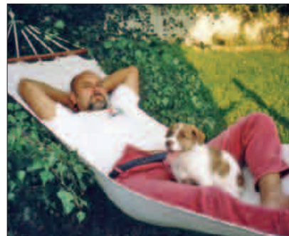
Siesta mit dem Herrl ...