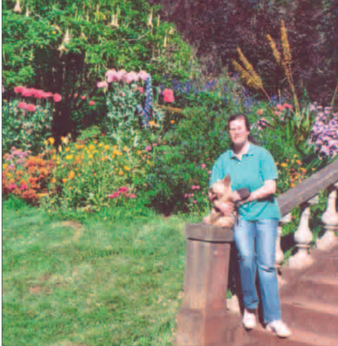
Madeira ist gerade im Juni ein Meer an wunderschönen Blumen.

Am nächsten Morgen begann die Entdeckung der Insel per Mietauto (Mensch und Tier zuliebe mit Aircondition). Wir wählen immer diese Art der Fortbewegung, da uns dies nicht nur Unabhängigkeit bietet, sondern auch die Mitnahme eines Haustieres bei gebuchten Touren ermöglicht, bzw. wenn die Nutzung von öffentlichen Verkehrsmittel problematisch ist.