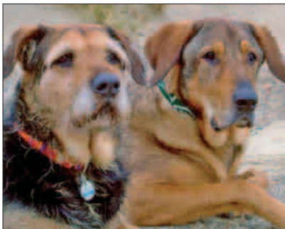
Ein schönes Paar – Inka mit Carlo (re.)