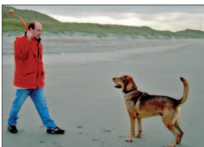
Bällchen – Carlos Lieblingsspielzeug ...